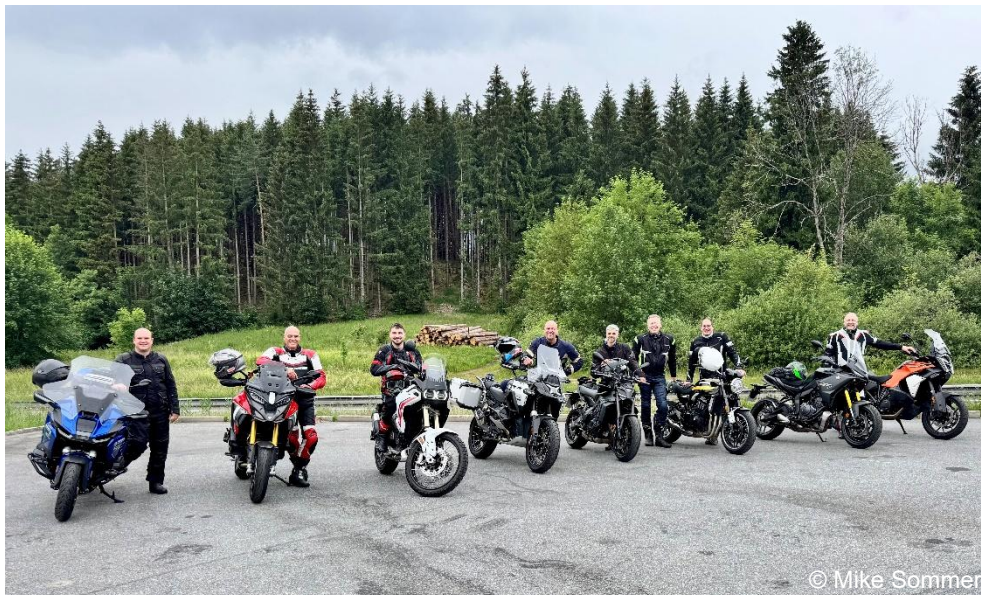
Eine der drei Gruppen, die auf der IVM-Jahreshauptversammlung eine Motorradausfahrt durch das Allgäu unternommen haben

Dienstag, 16. Juni 2026, 14 Uhr: Am Held Flagship-Store in Sonthofen herrschte reges Treiben und gute Stimmung, als sich die IVM-Mitglieder bereit machten für eine gemeinsame Motorradausfahrt. Bei bestem Motorrad-Wetter erkundeten die passionierten Motorradfahrerinnen und -fahrer das Allgäu, um den Tag im Anschluss bei einem gemeinsamen BBQ auf der Terrasse des Tagungshotels ausklingen zu lassen.