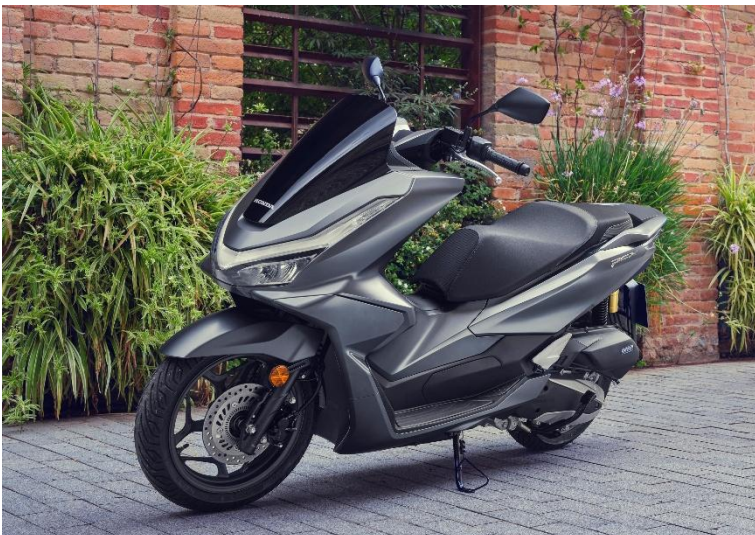
Honda PCX 125