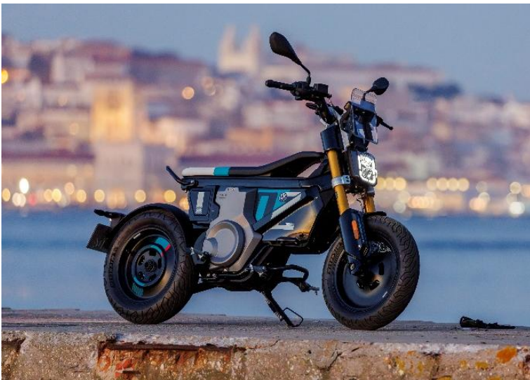
BMW CE 02

Verkehrsminister Patrick Schnieder wird beim Rundgang Gelegenheit haben, sich auf einen BMW CE 02 zu setzen. Das elektrisch angetriebene „Moped“ kann sowohl als AM-Fahrzeug mit Versicherungskennzeichen oder als echtes „Motorrad“ etwa fürs Pendeln vom Wohnort in die Stadt benutzt werden. Ein Honda PCX 125 Roller verdeutlicht dem Minister und den Besuchern, wie viel günstiger und emissionsärmer so ein Verbrenner-Einspurfahrzeug im Vergleich zu Pkw in der Stadt genutzt werden kann.